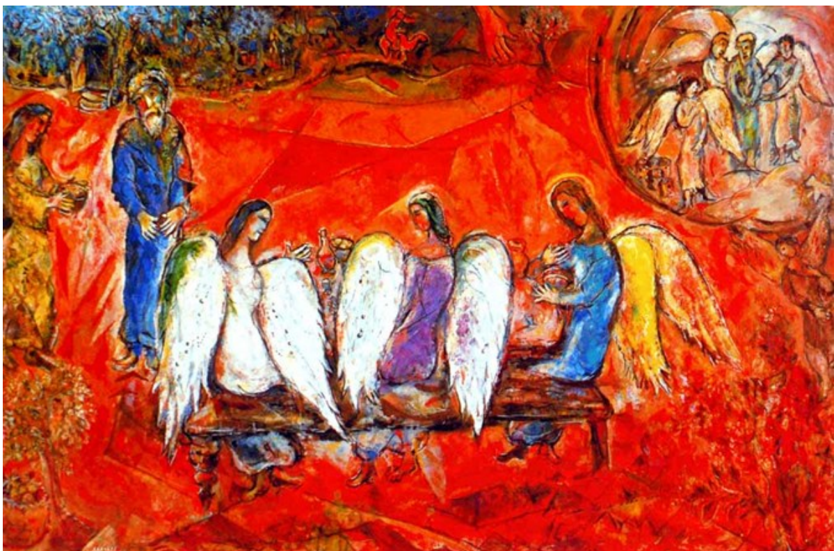
Marc Chagall, Abraham et les trois anges 1960-1966, huile sur toile, 190 cm x 292 cm Musée national Marc Chagall, Nice