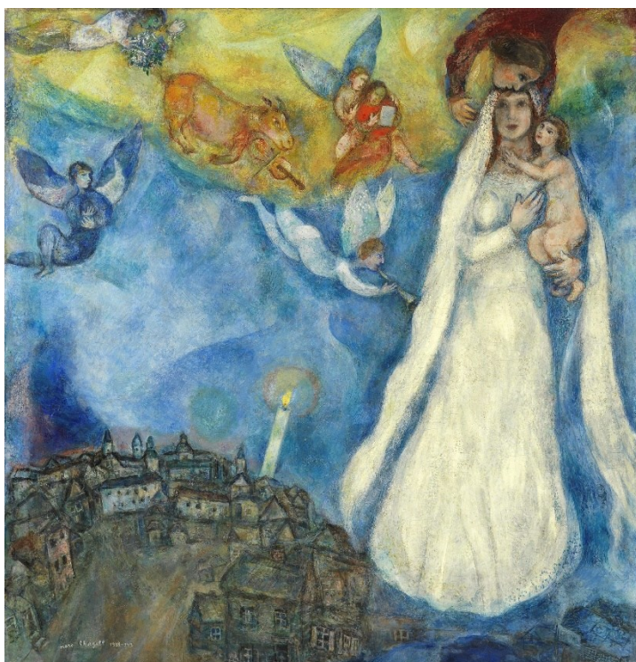
Marc Chagall, La Madone du village Huile sur toile 102.5 x 98 cm Museo Nacional Thyssen-Bornemisza, Madrid

MARCHE AVEC NOUS, MARIE, AUX CHEMINS DE CE MONDE, ILS SONT CHEMINS VERS DIEU, ILS SONT CHEMINS VERS DIEU.