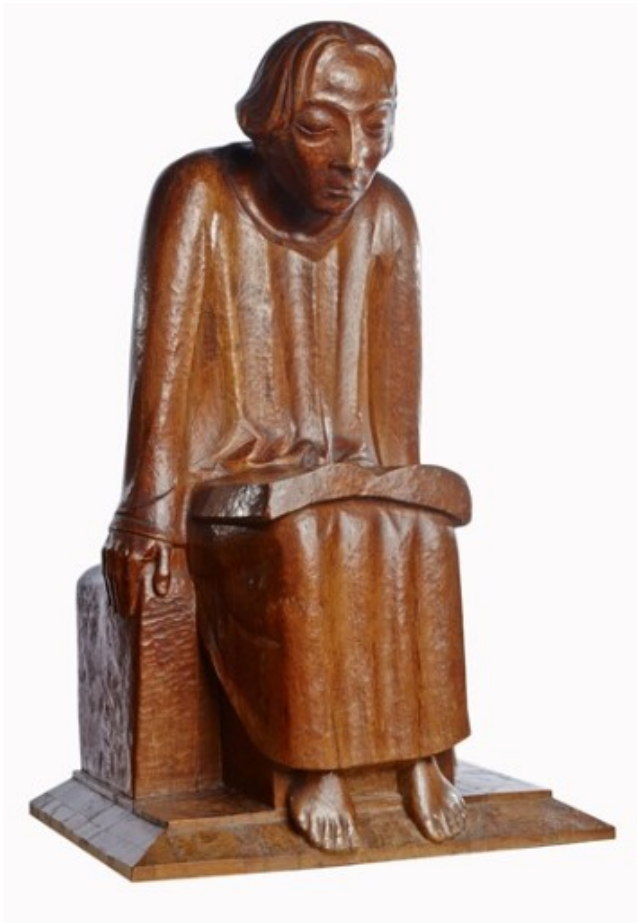
Ernst Barlach, Lesender Klosterschüler 1930 Holz (Eiche), Höhe: 114,8 cm Gertrudenskapelle Güstrow